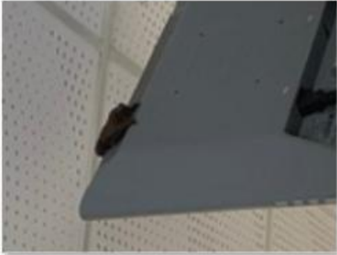
Sur l'écran de l'ordinateur