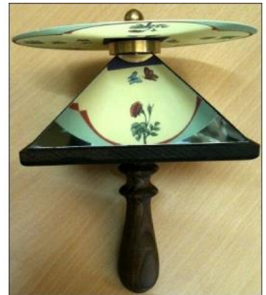
Une toupie fantoche