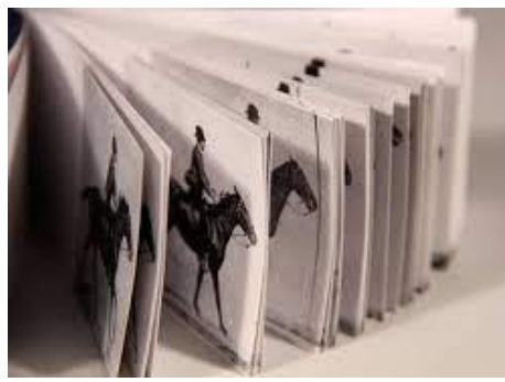
Des flips books (des folioscopes)