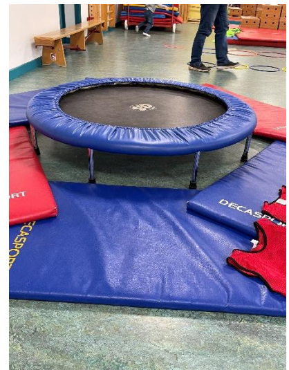
sauter haut grâce à un trampoline