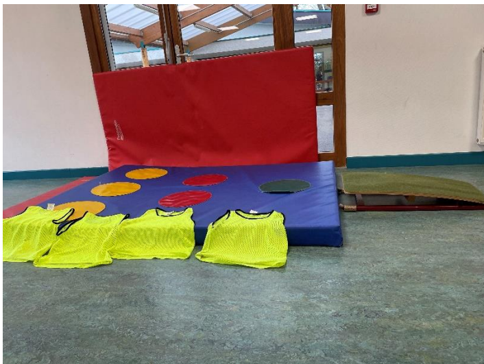
sauter le plus loin possible grâce à un tremplin

Nous avons également découvert mardi les nouveaux ateliers de motricité. Jusqu'aux prochaines vacances, nous allons travailler en motricité sur un nouveau cycle : « sauter ».