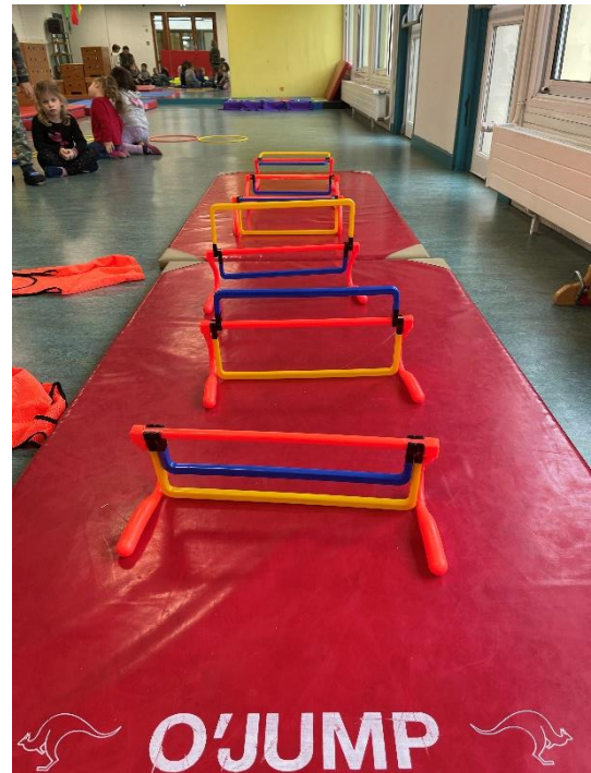
sauter au-dessus des haies (en hauteur, en longueur)