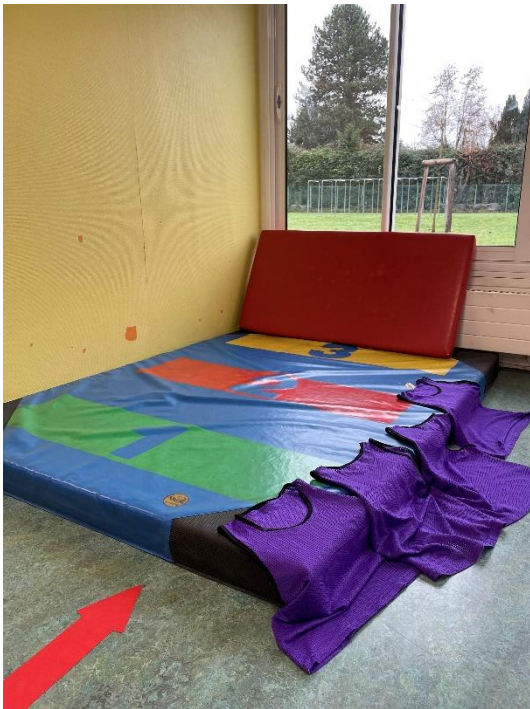
sauter le plus loin possible, sans aide matérielle