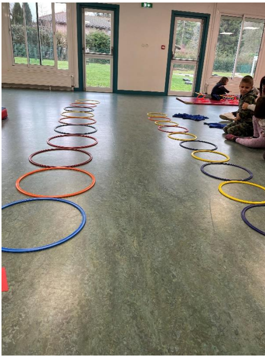
sauter à pieds joints et à cloche-pied dans des cerceaux