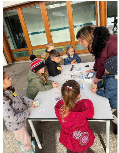
Le premier, animé par la maman d'Emy et Mila, consistait à déterminer si les fruits et légumes poussaient sous la terre, sur la terre, sur des plants ou sur des arbres.