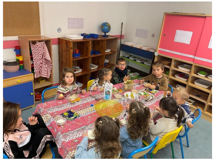
Le petit déjeuner nous a beaucoup plu ! Nous avons dégusté des céréales de riz soufflé , du lait et des bananes .

Grâce à l'intervention de Claire dans notre école, nous étions répartis en trois groupes afin de réaliser trois ateliers différents.